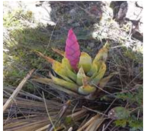
Fig. 8.