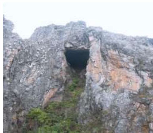
Fig. 12. Fuente: Comunidad campesina de Piscobamba. Cielo Punku. 2019.

Cielo punku , ubicado en el cerro llamado Altar pata del centro poblado de San Miguel de Piscobamba, con una altura de 50 metros que tiene una vista espectacular hacia el valle Payqai y Chumbao. Se puede practicar el trekking, debido a que para poder acceder dentro de Cielo punku se necesitará todo un sistema de arnés (cuerda) para poder explorarlo ya que no se puede acceder fácilmente.