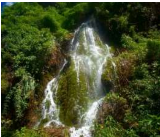
Fig. 10. 50 ml de altura. Cascada. 2019.

La cascada, es una catarata que cuenta con una caída aproximadamente de más de 50 metros de altura, el agua de esta cascada está libre de contaminantes y es totalmente cristalina, formando así el peculiar color blanquizo, dentro de la cascada se puede observar los musgos que le dan ese color resaltante a la magnífica maravilla. En la caída del agua, forma un pequeño reservorio, se puede dar un baño. Alrededor, cuenta con una vegetación tupida, increíble el cual le incrementa el valor y lo convierte en un atractivo turístico para todos los que aman la naturaleza, tiene una caída espectacular permite realizar una hermosa sesión de fotos y escenas de películas, porque cuenta con una vista maravillosa. Alrededor del reservorio, encontramos la planta conocida como si una, que es una planta casi similar al carrizo y es utilizada para elaborar chozas y cercos para el cuidado de sus animales.