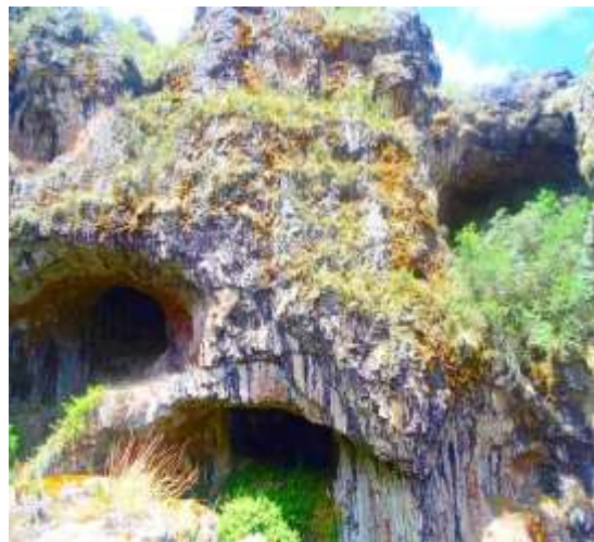
Fig. 3. Fuente: Comunidad campesina de Piscobamba. Kimsa machay. 3860 msnm. 2019.

traducción significa “lugar de ceremonia o encuentro”. El cerro Altar pata colinda con el cerro Huancavelica y caballerías, está ubicados aproximadamente a 3860 msnm.