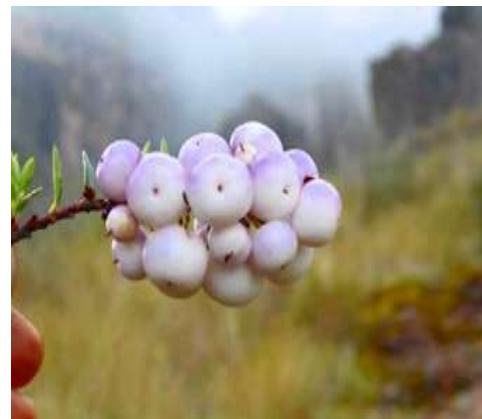
Fig. 6. Fuente: CC Piscobamba Mullaca blanca