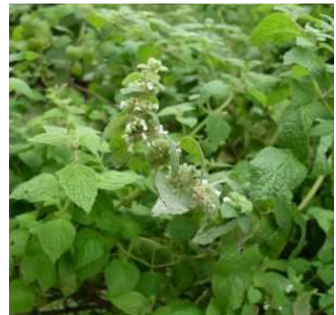
Fig. 9.