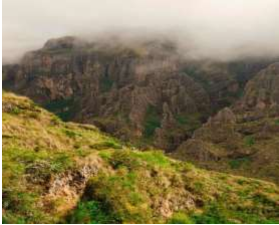
Fig. 1.

Estos recursos son conocidos, visitados por pobladores del centro poblado y comunidades cercanas, pero desconocidos para pobladores de las provincias Andahuaylas, Chincheros, [2] por limitaciones para fortalecer la accesibilidad. A la fecha no existe inventario de estos recursos naturales turísticos, debido a que existe escasez presupuestal, especialistas para el levantamiento de datos, equipo de precisión para levantamiento de geo referencia en UTM, entre otros.