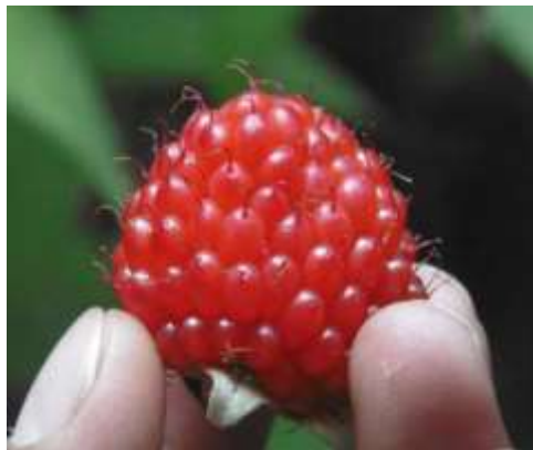
Fig. 5.