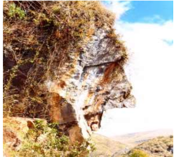
Fig. 141.

Leyenda: Cuenta la historia que los pobladores sienten un gran respeto hasta el día de hoy por este Apu porque cuando realizan pagapas y oraciones sus producciones y cosecha son benéficas, abundantes. También evitan cometer robos y malas acciones porque este Apu todo lo ve y castiga los malos actos.