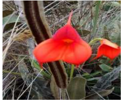
Fig. 7.