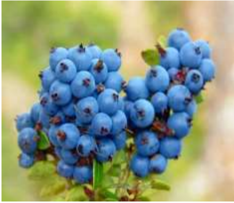
Fig. 4.