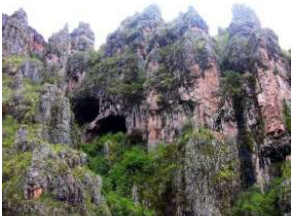
Fig. 2. Cuevas en Altar pata. 2019

La vulneración es mínima debido a la ubicación en la parte alta por encima de los 3500 msnm, gracias a ello ha permitido que se mantenga en el tiempo y que solo sea afectado por fuerza natural. [14] además del factor natural, otros factores son incidentes para preservar los recursos naturales turísticos, ceñido a la gobernanza comunal, la forma en el uso de recursos naturales y su distribución. Estas decisiones, se aprueban en asamblea comunal, y es de rigor cumplir las disposiciones aprobadas de protección y conservación.